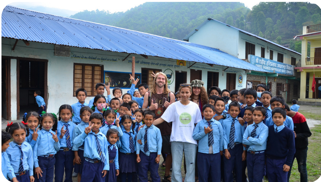
Bei der Besichtigung einer Schule in Khoramukh